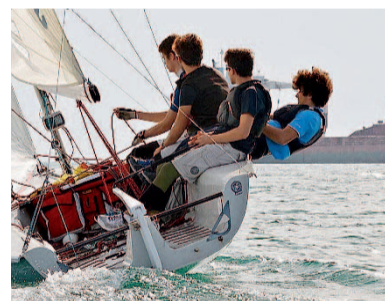
MONDIALE I baby di Ondabuena